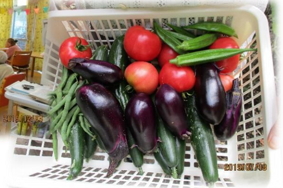
施設で作った野菜