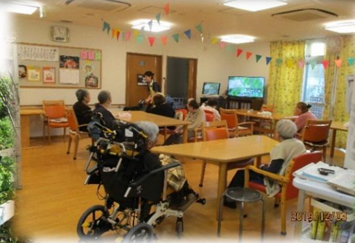
明るいきりびんぐ