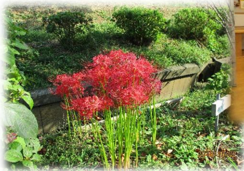
秋のお散歩、彼岸花