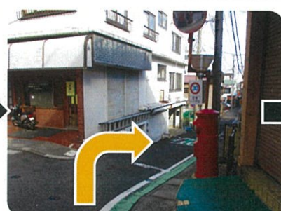
③赤いポストがある通りへ進みます。