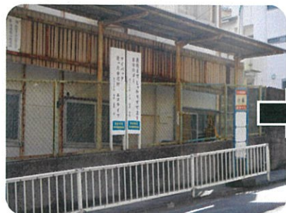
①小嵐のバス停で降ります。