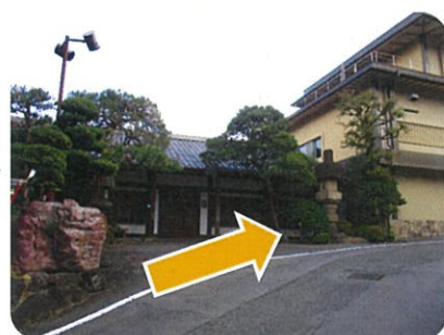
⑥石亭旅館が見えてきたらもう少し!!