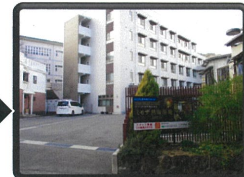
ミモザ熱海湯庵に 到着です!!