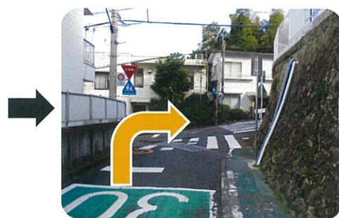
⑤T字路を右に曲がります。