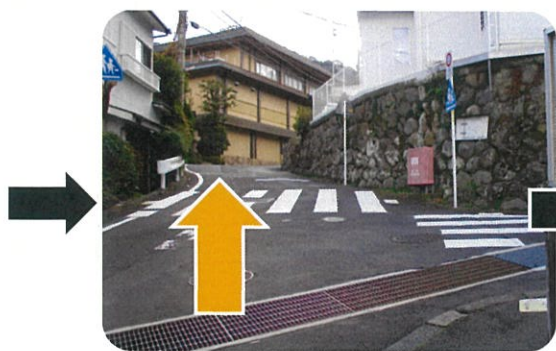
④この分かれ道は まっすぐ進みます。