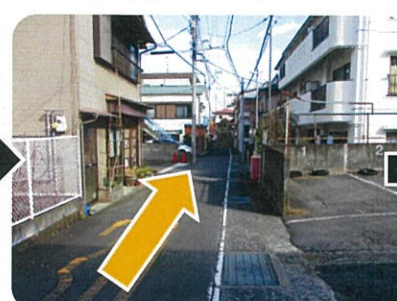
④道なりにまっすぐ進みます。 途中小学校が見えてきますよ～！