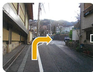
⑦ここを右に曲がると・・・