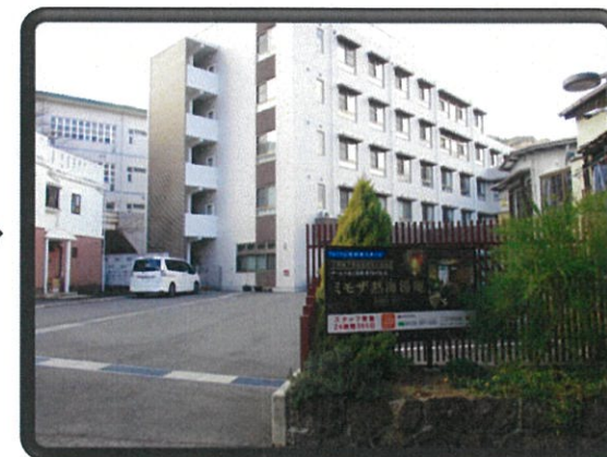
ミモザ熱海湯庵に到着です!!