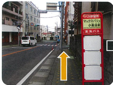
①マックスバリュ小嵐 店前下車し、下ります。