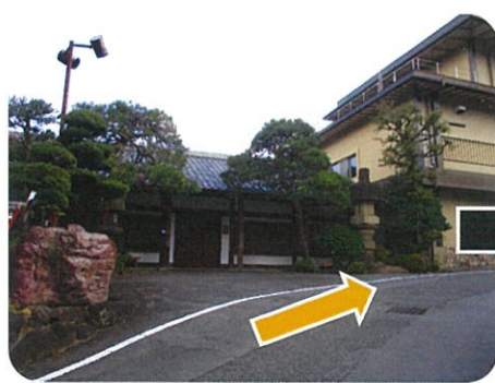
⑤石亭旅館が見えてきたら もう少し!!