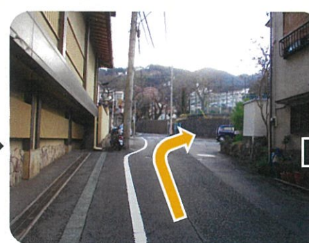
⑥ここを 右に曲がると・・・