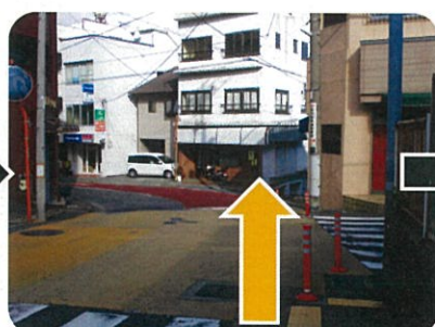
②ここは右に曲がらず通りすぎます。