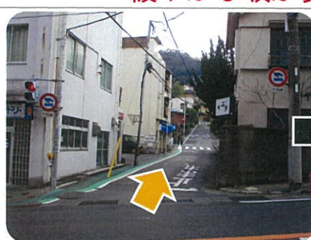
③緩やかな坂ですが、息が上がりますので ゆっくりのぼってきてくださいね。