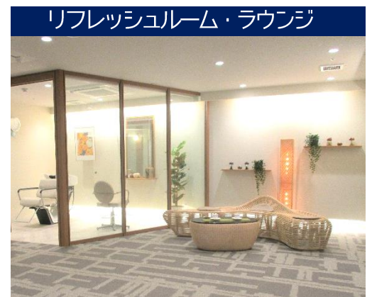
リフレッシュルーム・ラウンジ