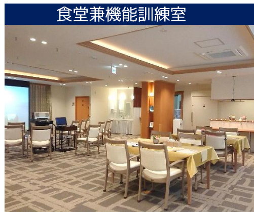
食堂兼機能訓練室