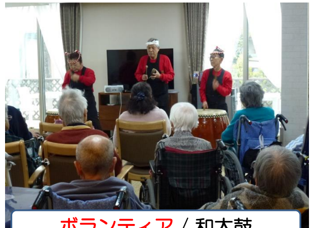
ボランティア / 和太鼓