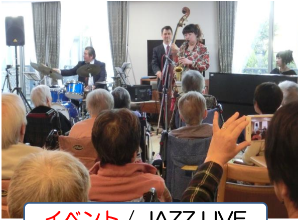
イベント / JAZZ LIVE

毎日の健康維持の体操は勿論の事、絵手紙や書道などのレクリエーションや外出レク、映画鑑賞会など 充実したイベント を実施しております。ボランティアによるイベントも随時、また、クリスマス会、お花見などの季節に応じたイベントもご提供いたします。