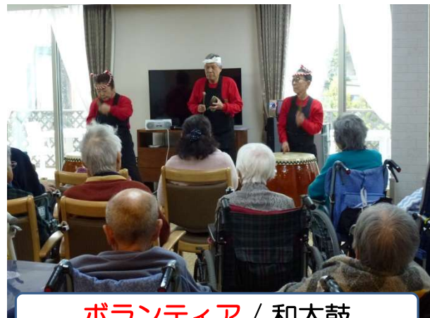
ボランティア / 和太鼓