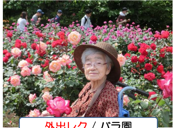
外出レク / バラ園