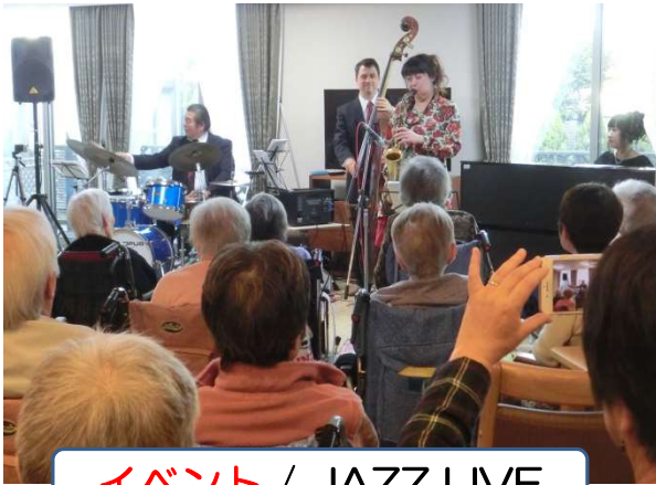
イベント / JAZZ LIVE

毎日の健康維持の体操は勿論の事、絵手紙や書道などのレクリエーションや外出レク、映画鑑賞会など 充実したイベント を実施しております。ボランティアによるイベントも随時、また、クリスマス会、お花見などの季節に応じたイベントもご提供いたします。