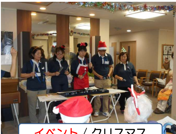
イベント / クリスマス