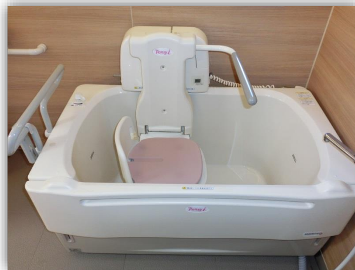
■1階は機械浴槽を導入しています