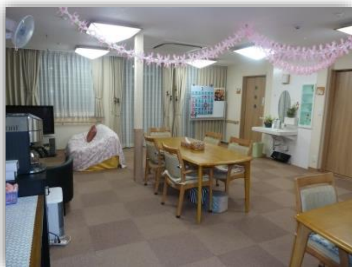
■明るいリビングです