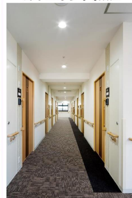
廊下には手すり設置