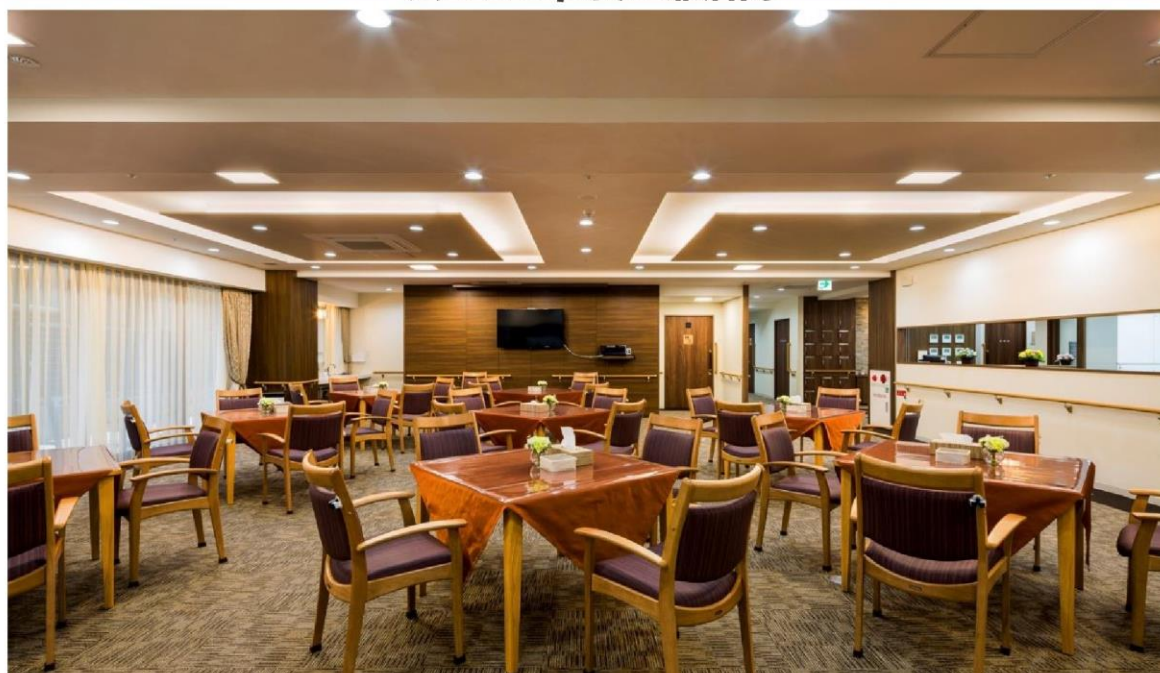
広々とした食堂兼居間