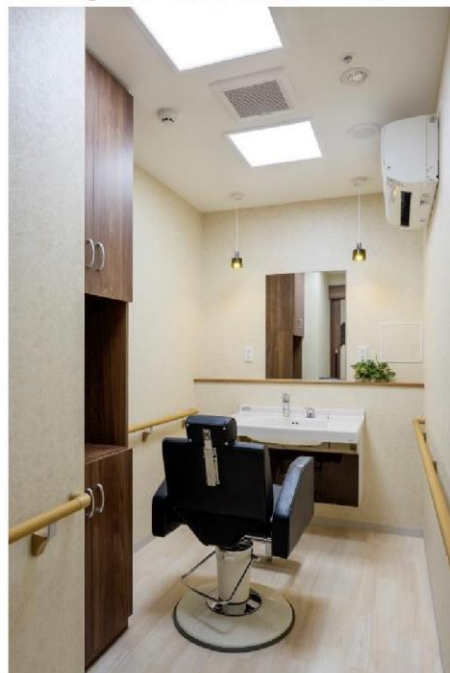
リフレッシュルーム