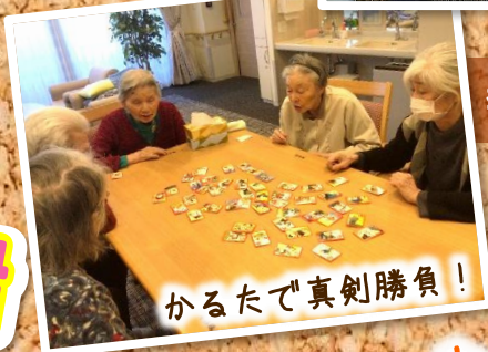
かるたで真剣勝負！