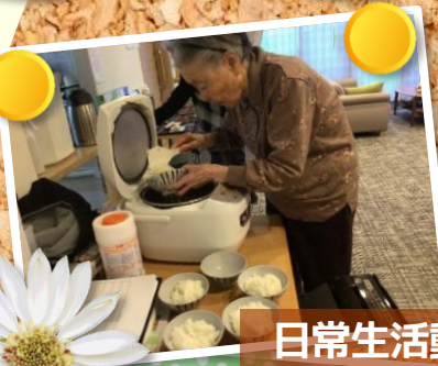
日常生活動作の維持・向上