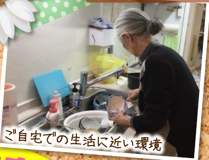
ご自宅での生活に近い環境