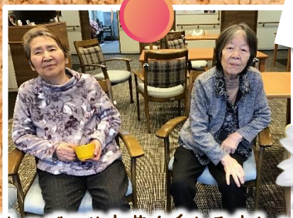
おしゃべりやお茶を楽しみましょう