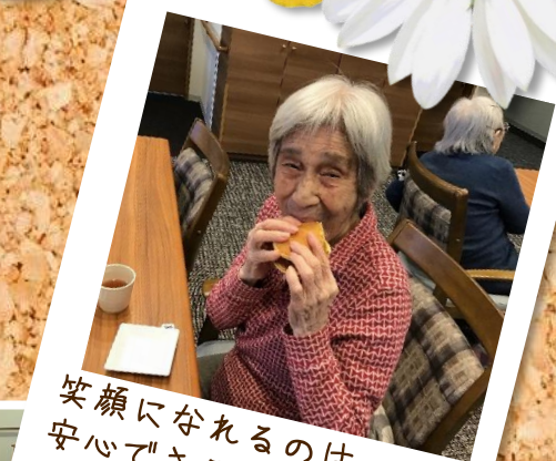
笑顔になれるのは 安心できる場所だから😊