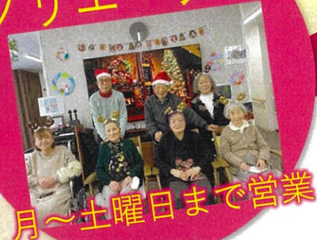
月~土曜日まで営業