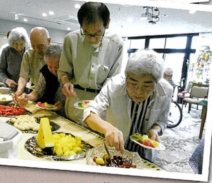
※写真はミモザ他施設での様子です。