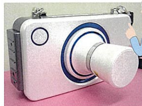
ポータブルレントゲン