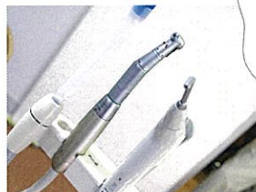
ポータブル歯科用ユニット