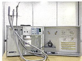
ポータブル歯科用ユニット全体